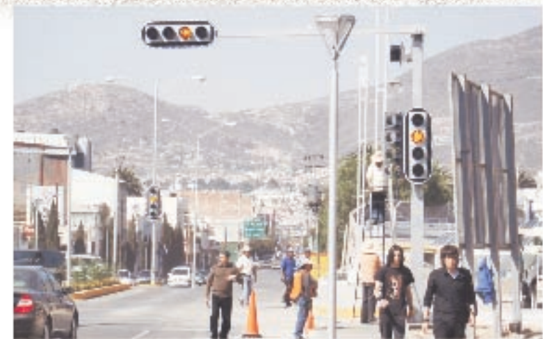
Los semáforos ya operan en la calle Jaime Núñez y Río de las Avenidas, en Pachuca.

200 mil horas de funcionamiento garantiza el equipo