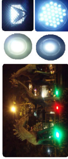
Iluminación con LEDs