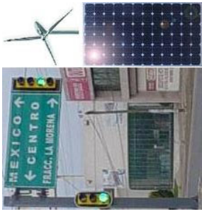
Semáforo, turbina eólica y panel solar.