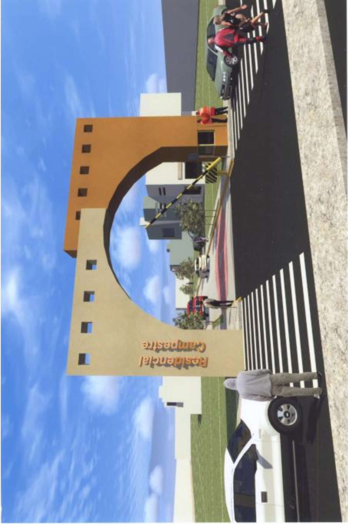
Proyecto: Fraccionamiento Residencial Campestre Perspectiva: Acceso Principal