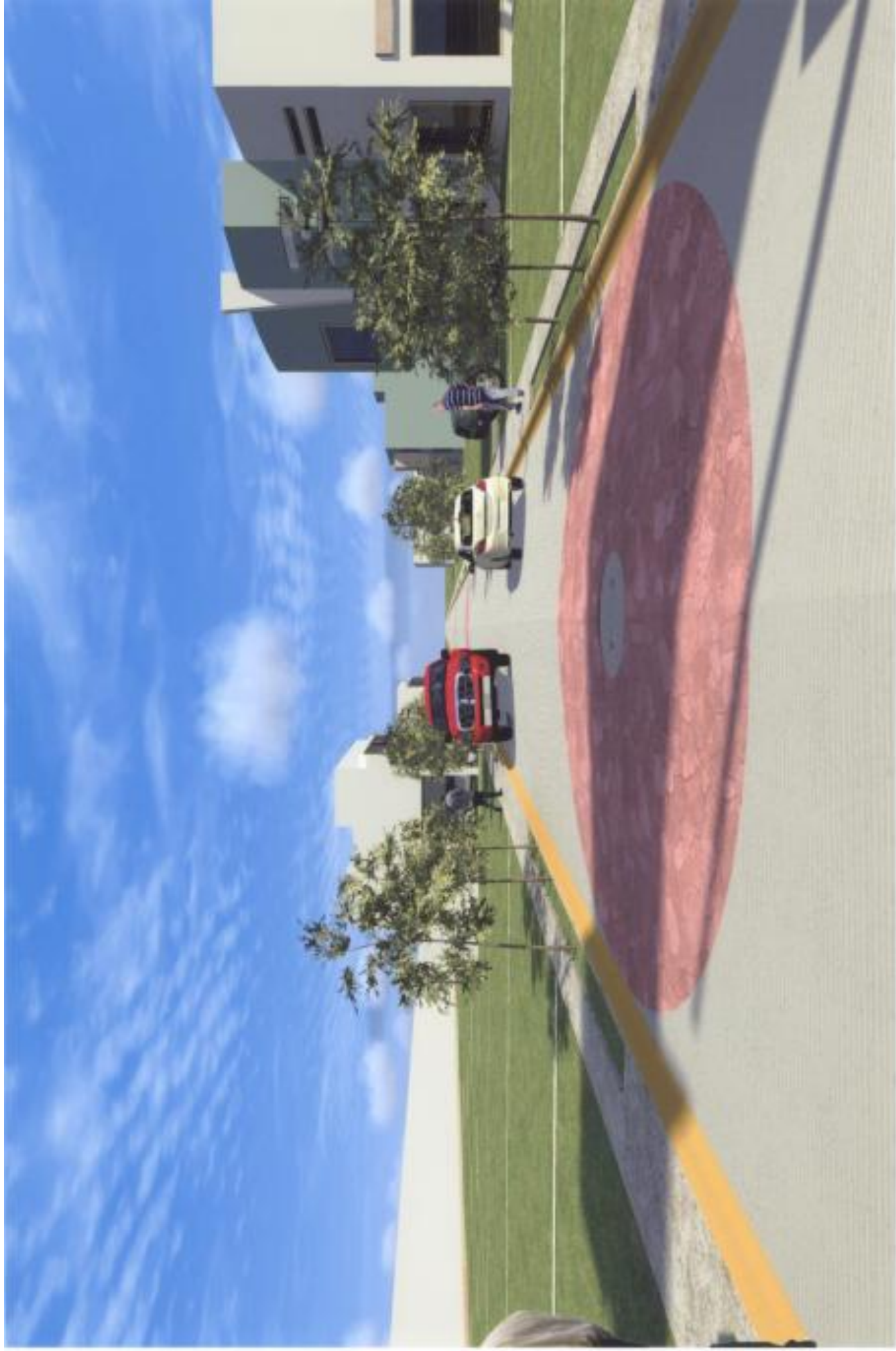
Proyecto: Fraccionamiento Residencial Campestre Perspectiva: Vialidades