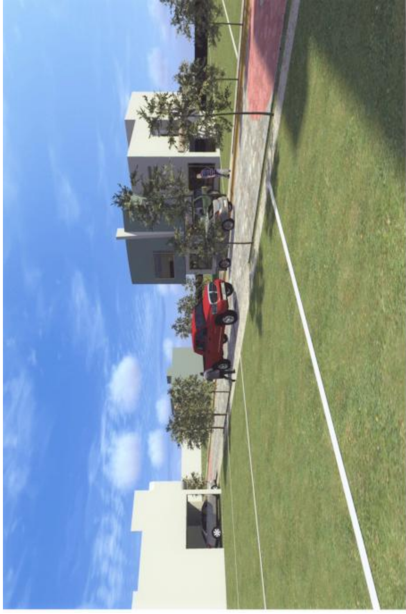
Proyecto: Fraccionamiento Residencial Campestrre Perspectiva: Vialidades